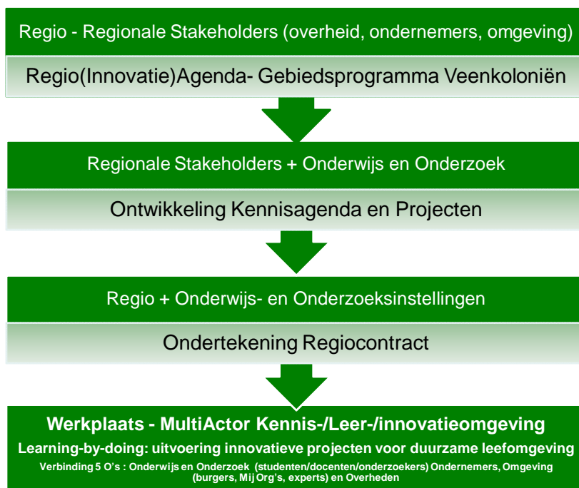
Figuur 1 – Kennisraamwerk

Op basis van het Gebiedsprogramma Veenkoloniën (2008-2012) is een programma van vernieuwingsprojecten ontwikkeld, die onderwijs- en onderzoeksinstituten samen met de regio de komende jaren gaan uitvoeren in de Werkplaats. Deze is vastgelegd in de Kennisagenda Veenkoloniën. De Kennisagenda is een onlosmakelijk onderdeel van het businessplan.